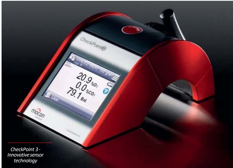
CheckPoint 3 - Innovative sensor technology