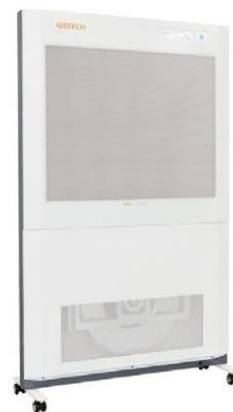
ACP-897AH ACP-897BH クリーン仕様